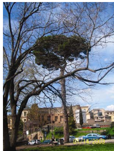
Развалины бань Тита