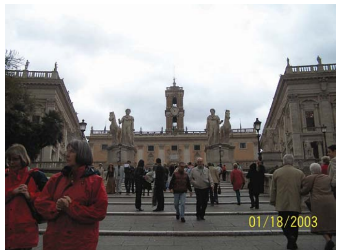
Piazza di Campidoglio